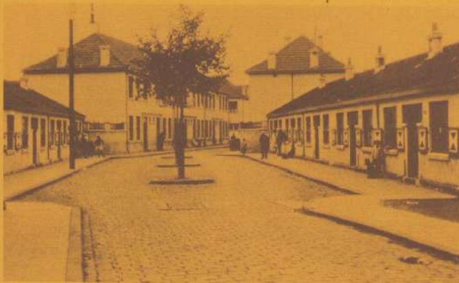
Schwartzenbergerstraat in de 30er jaren.