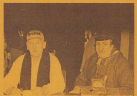
(12) Met de groeten aan Brinkman...