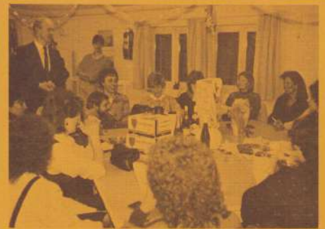
(3) Opening Kelderke Theresiaschool