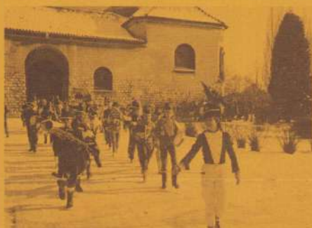
(7) Harmonie de "Drolle Kloppers"