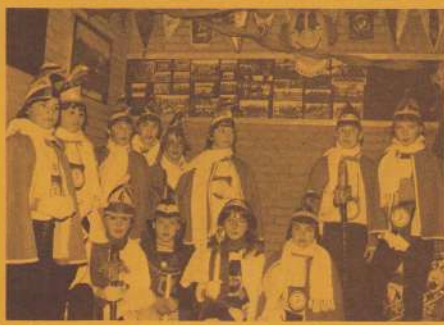
(10) De Maosretjes bij de Kevers