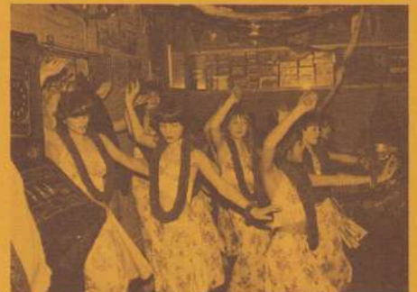
(6) Hawaii-meisjes (bij de Kevers)