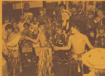
(5) Hawaii-jongens (schoolkarnaval)