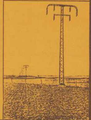
Paal 50 kV-lijn.

MARCONI (1874-1937), Italiaans uitvinder van de draadloze telegrafie.