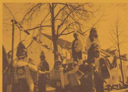
(8) Optocht met de Maosretjes