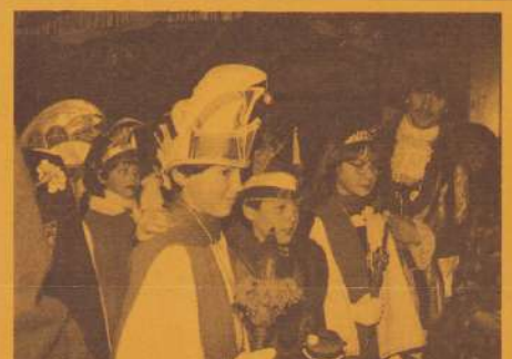
(9) Drie prinsen, één prinses