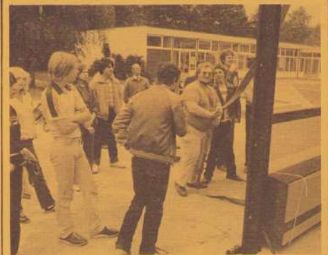
De Jongerenkeet in aanbouw .

Oud en jong heeft zich die dag uitstekend geamuseerd . En dan te bedenken dat dit mogelijk werd door de samenwerkende buurtbewoners die in hun vrije tijd dit speelveldje hebben gerealiseerd . Pet af ! Niet alleen de kinderen hebben er nu een voorziening bij , ook voor de oudere jeugd heeft deze zomer een lang gekoesterde wens in vervulling gebracht : de keet ! Op woensdag 19 augustus kwamen er enkele grote vrachtauto's en een hijskraan en binnen enkele uren stond er de eigen ruimte voor de jongeren waarop ze meer dan een jaar gewacht hebben . Deze ruimte zal door de jongeren zelf beheerd worden en gelegenheden bieden zich overdag en 's-avonds te ontmoeten in een gezellige huiskamer-achtige sfeer .