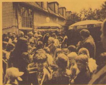
De opening van de speelweide .

Neen , dan worden we enthousiaster als we zien welk een goed gebruik er gemaakt is in de vakantie van het spelterreintje aan de Edisonstraat . Ouders en kinderen konden daar iedere dag terecht en dat dankzij de belangeloze inzet van enkele buurtbewoners die zorgden dat het terreintje zo goed mogelijk beheerd werd . Overigens het openingsfeest van het terreintje was een geweldige leuke activiteit waarvan we nog een foto hebben toegezonden gekregen .