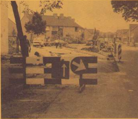
Volop wordt gewerkt aan de verbetering van de verkeerssituatie.

ter door Burgemeester en Wethouders verworpen. We zijn benieuwd wat er dan nu gaat gebeuren.