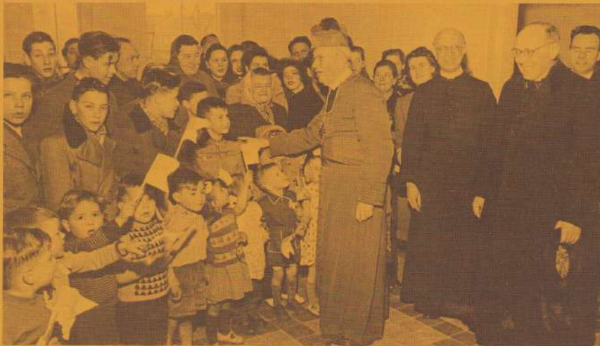
Eerste nieuwbouw Wijkhuis in Nederland Gazet van Limburg 15 Jan. '54