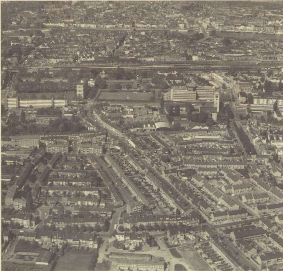
18-05-1984; midden-links Tuinwijk, rechtsboven de thans gesloopte Elektro buurt.