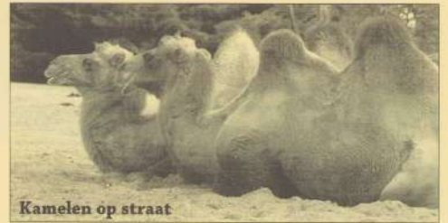
Kamelen op straat

op het buurtfeest (zondag 28 juni) Manus van Alles, maar daarvoor een voorproefje voor de basisschoolleerlingen van groepen 7 en 8 van De Letterdoes, het Brede Spoor en De Regenboog: