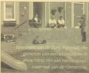
Bewoners van de Burg. Pijlstraat, die genieten van een leetdag en in afwachting zijn van nieuw speel-materiaal van de Gemeente.

Plattegrond van de plannen: 1, 2, 3 en 4 zijn de renovatiegebieden; A, B en C de mogelijke sloopgebieden. En dan zijn er nog de zgn. 'studiegebieden': noordzijde Bauduinstraat en omgeving Hofmeiersplein. De noordoostkant van de Burgemeestersbuurt valt overal buiten. Waarom?