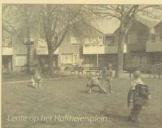
Lente op het Hofmeiersplein.