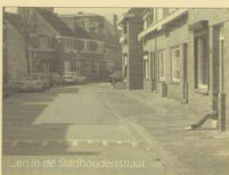
...en in de Stadhoudersstraat.