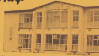
1983 is ook het jaar van de verhuizing. Het buro van het maatschappelijk werkers heeft zich in het bekende Wijkhuis Ma

Dit jaar werd ook het jaar van de MUUR. Er is veel over geschreven en gezegd. De muur illustreert in onze ogen hoe de besluitvorming er in onze democratie soms toe gaat: de plannen worden van achter een buro gemaakt en uitgevoerd, terwijl er geen rekening gehouden wordt met wat bewoners en betrokkenen er eigenlijk van vinden. Inspraak achteraf is een farce. Jammer, de miljoenen die aan dit project opgaan, hadden beter besteed kunnen worden.