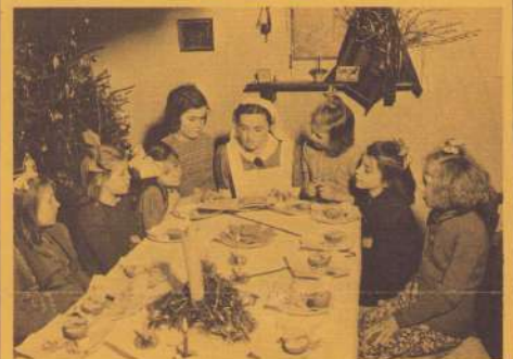
KERSTMIS IN MARIS STELLA

Twee foto's uit de vijftiger jaren. Toen er nog kerstvieringen werden gehouden in het wijkhuis. Op de eerste zien we de meisjesclub in het gebouw aan de Tillystraat 70, waar van 1949-1953 ook een deel van het clubwerk onderdak vond. De foto stamt dus uit deze periode. De tweede is genomen in het tegenwoordige gebouw aan de Schaepmanstraat in 1956, dat sinds 1954 in gebruik is.