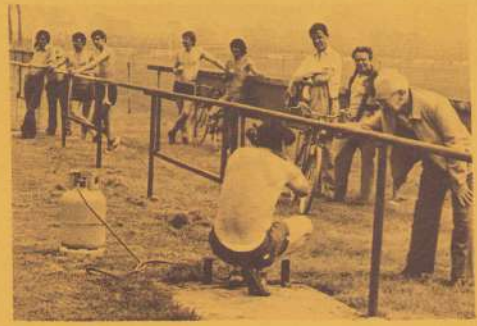
Ook in het Geusseltsportpark vonden verhuizingen plaats. Hier ziet U leden van voetbalclub Willems-1 bezig de afrastering van hun nieuwe onderkomen op te knappen.

Ook het Lotharingenplein werd dit jaar aangepakt. Enkele blokken zijn inmiddels gereed. Dat alles niet zonder problemen verloopt blijkt wel uit een nota van het bewonerscomité. De gemeenteraad zal hier nog een hele kluit aan krijgen!