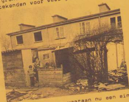
lange lijdensweg, waaraan nu een einde is gekomen.

De laatste betonwoningen trotseerden de winter. Dit jaar gingen ze tegen de grond. De plannen voor de sloop betekenden voor veel gezinnen een