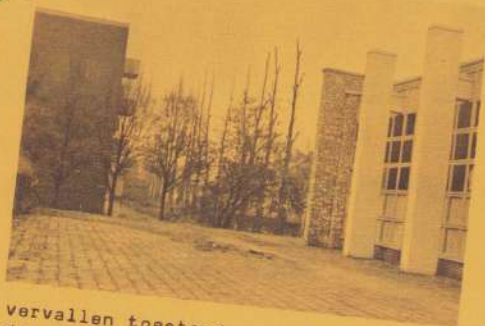
vervallen toestand van het plein bij de voormalige "Blokkschool". Inmiddels is bekend geworden dat de gemeente een krediet beschikbaar stelt om het plein een beter aanzien te geven.

Mede door de buurtkrant werd een actiegroep "Fijn Plein" in het leven geroepen. Eindelijk werden plannen gemaakt om eens wat te doen aan de