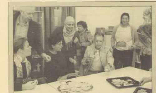
Proef de Wijk editie Wijckerpoort - Wittevrouwenveld kon ook deze keer weer rekenen op veel belangstelling.

Tekst: Adriëne Deurloo/Marianne Lucker