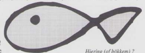
Hiering (of bökkem) ?

Soondes hófde geine te vaste, sjwaardes ederein boven de 15 jaor en oonder de 65. En luij mèt zjwoer werrek or kraanke hófden aoch neet. Vaste beteikende totsde dich mer eine kier de bekoms mogs ete per daag en de aander kiere zjus neet genóg. En op vriedeg waor 't zoewiezoe oonthaajdingsdaag, dat wèlt zègke totste ouch nog gei vleisj mogs ete. Dus zag Pa: "dan ete de erme hiering en de rieke kaviaar". En Pa waor òm ter duivel geine roeje! Euverigens vösj ete is gei vergif.