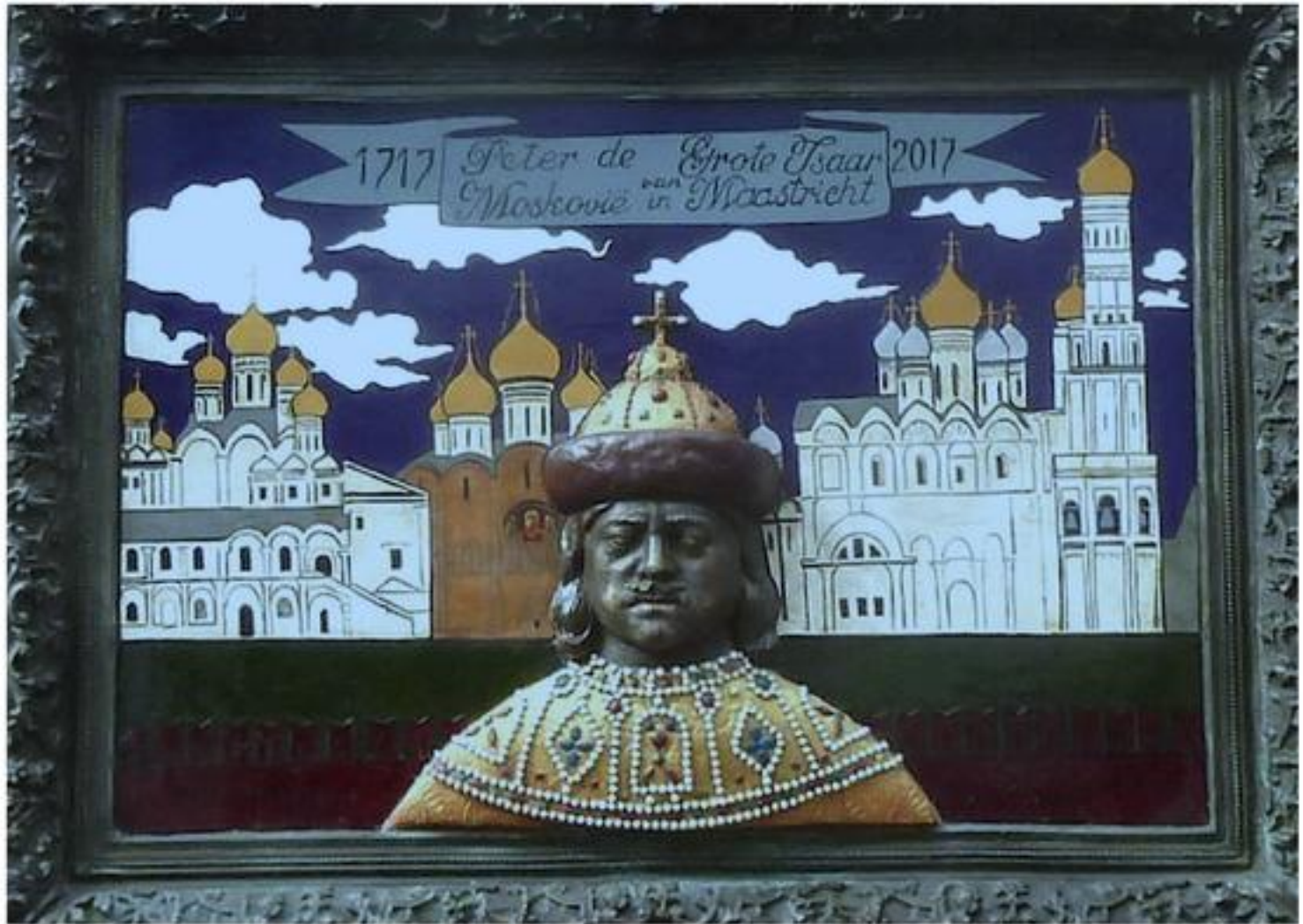
Achter het Vleeshuis, ingang Bijenkorf