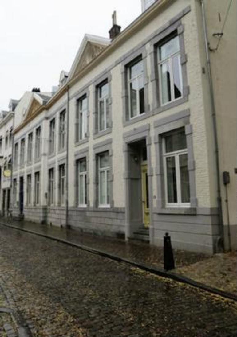
Maastricht vroeger en nu: Kleine Gracht