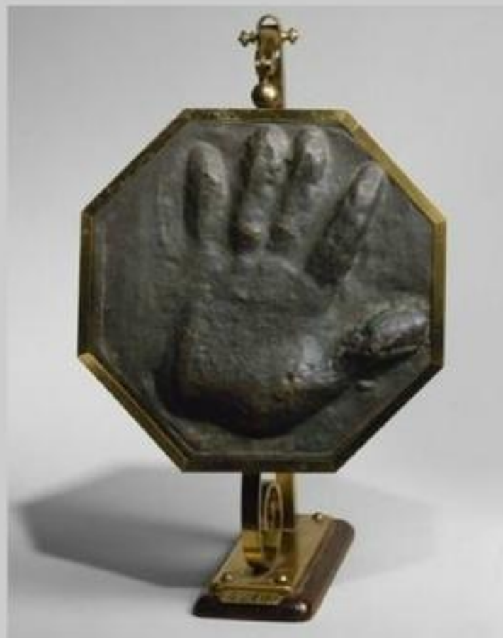
Handafdruk van Peter de Grote