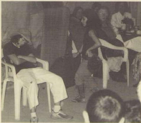
De kinder-toneelclub van 't Vrouweveld speelde op kerstavond in de grotten van België o.l.v. Petra en Bas