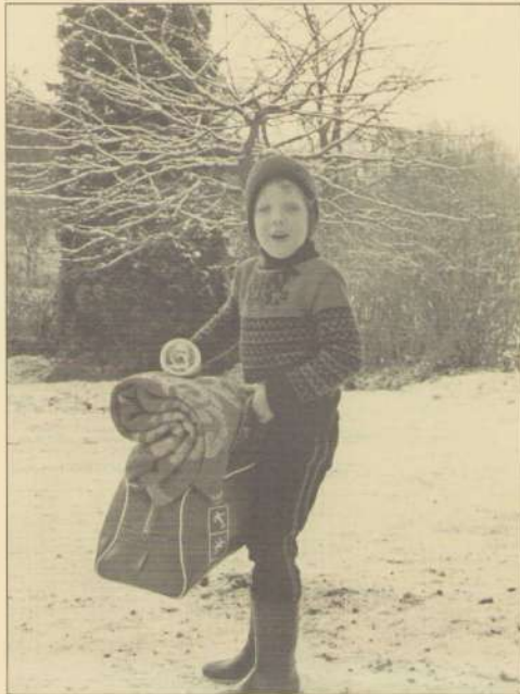
Sleetje rijden is van alle tijden