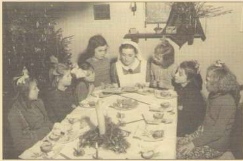
Kerstfeer in het Wijkhuis, met appel