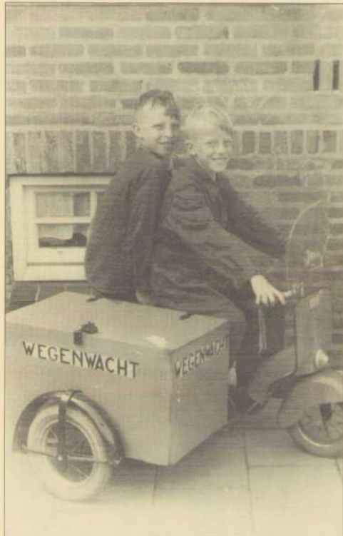
Buurtherinneringen: Rij met je hart

"Mijn straat is net een racebaan", melden veel inwoners bij het Veilige Buurten Team. Mensen die ook zelf het probleem willen aanpakken kunnen gratis de Rij met je Hart-stickers afhalen bij het Wijkservicepunt, Trefcentrum of de Inktpot. De stickers kunnen op de groenbak geplakt worden. Zo valt de oproep elke 14 dagen weer opnieuw op. Overlast door hard rijden kan ook altijd gemeld worden bij het Veilige Buurten Team.