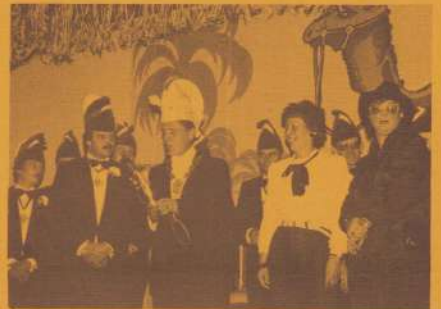
Installatie van Markies Huub11 van de Drommedarissen.