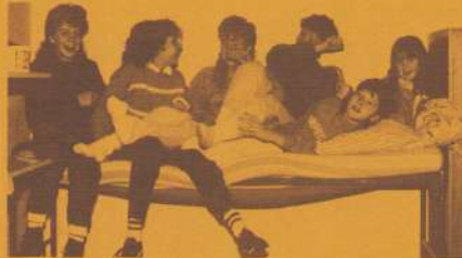
Willem 1-meisjes tijdens winter- weekend in de "Schark".

als je ergens mee zit. Op maandagavond vanaf 19.00 is er wekelijks VIDEO met films die de meisjes zelf kunnen uitzoeken/ bestellen. In april gaat er een groep meisjes op overlevingstocht in de Ardennen. De voorbereidingen daarvoor zijn steeds op dinsdagavond. Verder worden er vanuit de meiden- keet activiteiten opgezet in andere buurthuizen en jongeren centra. Misschien ook iets voor jou? Loop eens binnen of bel boven- staand telefoonnummer.