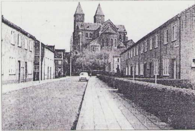
De Pastoor de Weverstraat rond 1962 en 2000. Zoek de 10 verschillen.