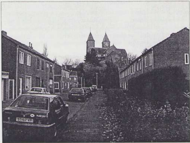
't Aörke no. 9 - pag. 36