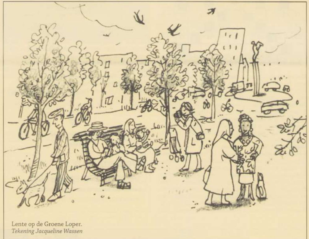
Lente op de Groene Loper. Tekening Jacqueline Wassen

Op zondag 31 maart a.s. organiseren Reisvereniging "Oonder Us" en Harmonie "De Gele Rijders" een snuffelmarkt in Trefcentrum Wittevrouwenveld. Bezoekers zijn welkom van 9:30 tot 16:00 uur, de entree bedraagt € 1,00.