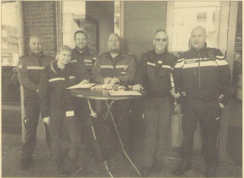
Iedereen woont en werkt graag in een veilige, schone, mooie leefbare buurt. Samen met bewoners wil de gemeente prioriteiten benoemen voor bewoners van Wittevrouwenveld op het gebied van leefbaarheid en veiligheid waar wij samen mee aan de slag gaan! Op de foto vereende krachten om te luisteren naar de bewoners.

Op donderdag 4 april is er een informatie bijeenkomst op de Edisonstraat 2 te Maastricht Wittevrouwenveld die begint om 20.00 uur.