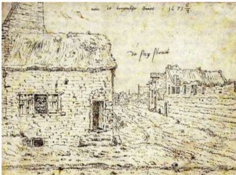
De 'Sapstraet' gezien vanaf de Tongersestraat, Valentijn Klotz, 1671

Huizen werden voornamelijk aan de zijde van de Tongersestraat gebouwd. Hier trad aan het einde van de negentiende en het begin van de twintigste eeuw, net zoals op meer plaatsen in de Maastrichtse binnenstad, een ernstige verpaupering op en vervielen veel huizen tot krotten. En, zoals in zoveel van dergelijke vervallen buurten, werd ook de Abtstraat het toevluchtsoord voor zogeheten stadsfiguren, die zich nog wel tevreden stelden met de erbarmelijke toestand van de woninkjes.