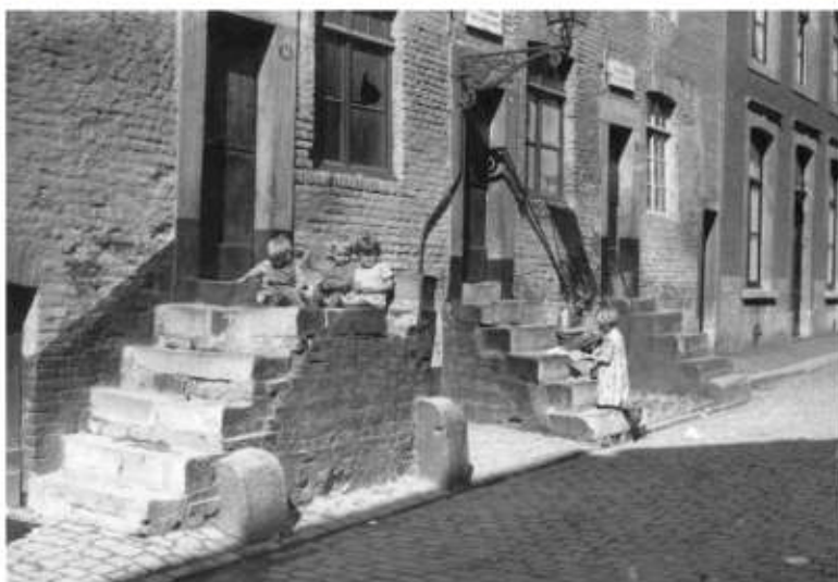
De Abtstraat in 1931