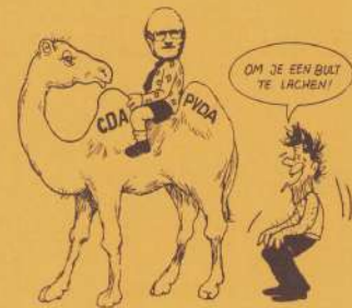
"van Drommedaris tot Kemeleer"

De Wittevrouwenwerkwinkel heeft ook een afdeling carnavalskleren. Misschien een leuke aanleiding om eens binnen te stappen (Burgemeestersplein 2).