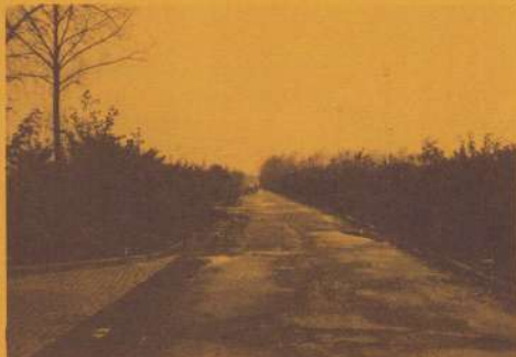
Bij de foto: Olympiaweg, zonder verlichting

Daarnaast zijn er nog klachten over de overlast van afwaaierende takken van bomen, het ontbreken van onderhoud van de groenvoorziening, het onbereikbaar zijn voor brandweer of ziekenauto als 's-zondags geparkeerde auto's van voetballiefhebbers de toegangsweg versperren, enz. Op maandagavond 18 maart was er in het Wijkhuis een bijeenkomst met enkele vertegenwoordigers van het kamp en twee vertegenwoordigers van de Gemeente die wat betreft de vijf hoofdpunten over mogelijke oplossingen kwamen praten.