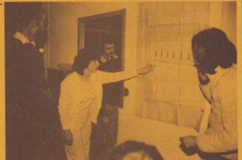
Bij de foto: Bewoners bekijken plannen.