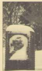
Beeld van Burg. van Oppen

Vragen of problemen? We hebben ervaring! Neem contact op met het Buurtplatform, we kunnen misschien helpen: platformwvv@gmail.com; 06-4044 8924 of 043-362 1232