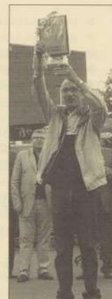
De voorzitter van de jeugd- en drumband ontvangt de Gouden Manus van het Buurtplatform WVV-Actief