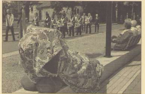
Jeugdtribune roffelt leeuwen op.