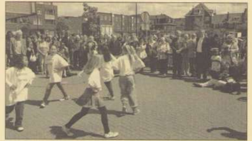
Openingsdansje door de Letterdoes.

Na afbraak van de Electrobuurt namen krassend waarzeggende kraaien en uitgelaten kinderen en honden bezit van het vrije veld.