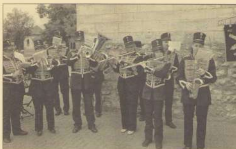
Gele Ridders verwelkomen de leeuwinnen in het Buurtpark ...

Van de Harmonie de Gele Ridders zou je lid worden alleen al vanwege hun geestige ledenblad! Zware concurrentie voor de Buurtkrant. En dan maken ze nog mooie muziek ook: zin om mee te doen? Ga eens luisteren en kijken op een repetitie: elke maandagavond (drumband) en dinsdagavond (harmonieorkest).