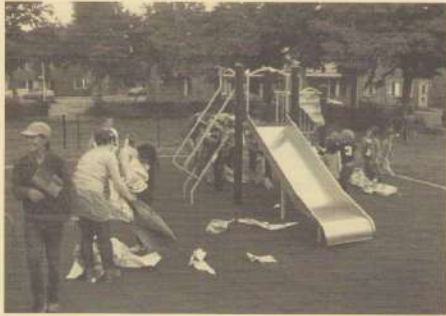
Opening speelvoorziening vernieuwde Friezenplein.