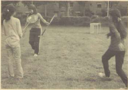
Sportcoach van Trajekt in actie op het Friezenplein, de mini-goaltjes bleven ongebruikt ...