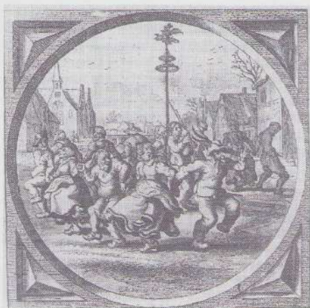
Dansen rond de Meiboom. Gravure van door A. van de Venne, uit Jacob Cats "Spiegel van den Ouden en den Nieuwen Tijd". Den Haag 1632.