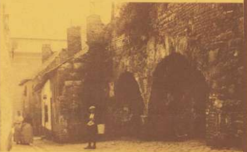
TENTONSTELLING STAKING STADSARCHIEF TOT 28 SEPT.