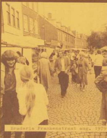
Braderie Frankenstraat aug. 1979