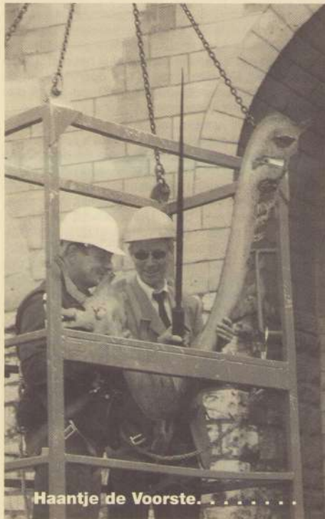
Haantje de Voorste. . . . .