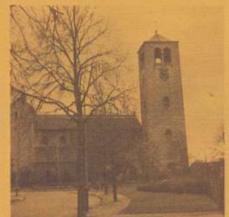
Deze kerk is geheel opgetrokken uit mergelblokken op een basis van kunraden steen naar ontwerp van fr. F. Peutz (1938).