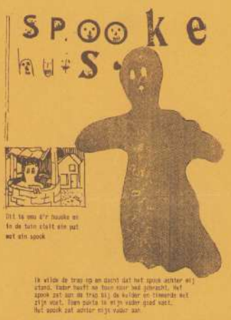
In veld de trap op en neer dat het spook achter wj stand. Vaker heeft de baan voor had geroekt, het spook zat aan de trap bij de kelder en vloerde met zijn staar. Toen was in en in vader goed vast. Het spook zat achter en in vader aan

Als vervolg op de "Griezeldag" van Kluphuis EDI is er in de taaldrukwerkplaats door kinderen een "griezelboek" gedrukt. Daarin staan enge tekeningen en verhalen, die de kinderen zelf gemaakt hebben. Wil je het lezen? Stap dan eens binnen in de taaldrukwerkplaats (in de "Blokkschool"). Hieronder een bladzijde uit dat griezelboek.