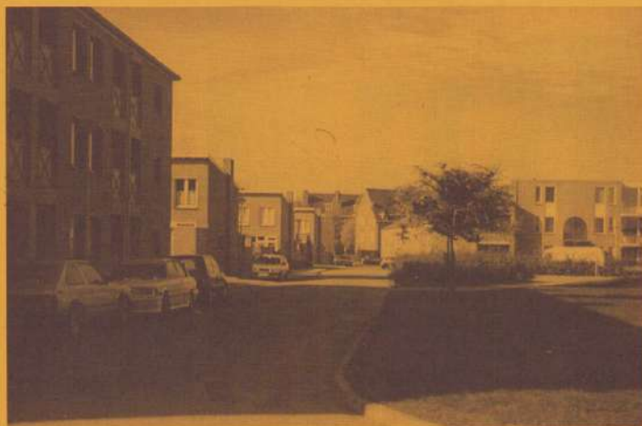
VOORBEELDIGE AKTIES BEWONERSCOMMISSIE FRIEZENPLEIN 80

Terug naar het heden, waar aan de weg getimmerd val-len immers spaanders. Rond het Friezenplein wordt niet alleen letterlijk maar ook figuurlijk aan de weg getimmerd. Op uitnodiging van de actieve Bewonerscom-missie Friezenplein en Omgeving en het Gemeentelijk Woningbedrijf bezochten circa 35 bewoners de presenta-tie van een onderzoek in de voormalige Taalddrukwerk-werkplaats.