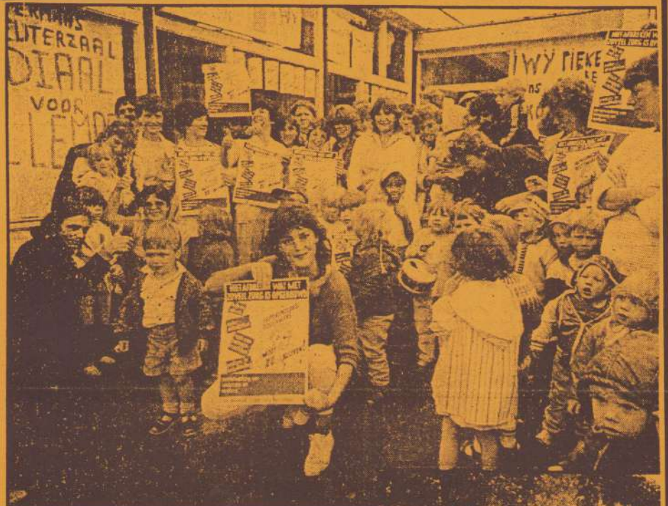
*Protesterende ouders en kinderen van de peuterspeelzaal Oostermaas.

Leidster uit Oostermaas: 'Het is meer dan vieze luiers verschonen'