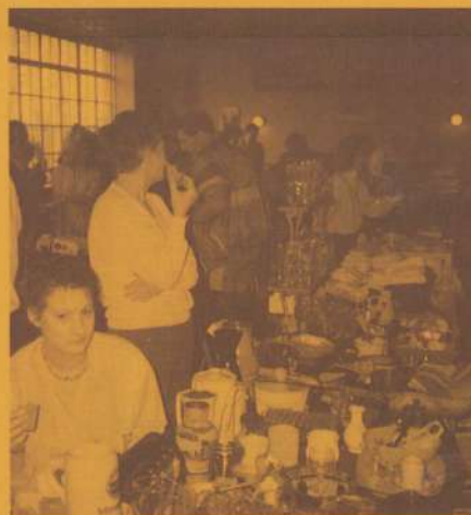
De vorige snuffelmarkt in het Trefcentrum