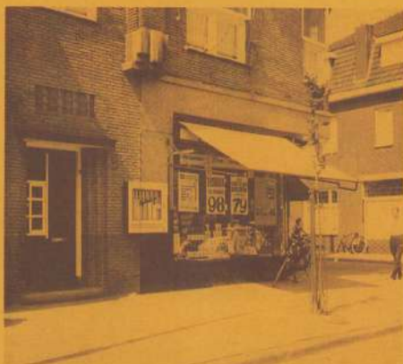
DE "COÖP" 1-10-1964. DE CIGARETTEN MAAKTEN PLAATS VOOR DE GELDAUTOMAAT