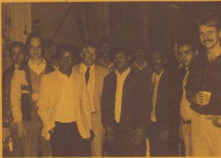
Foto links : Marokkanen en Witte Vrouwen velders samen tijdens het parochiefeest .