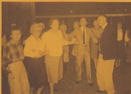
foto blijkt. Het orkest bracht met zijn aangepaste, maar toch erg vlotte muziek heel wat mensen op de dansvloer. Ook degenen die niet meer tot dansen in staat zijn genoten zichtbaar van het ritme van dans en muziek. Hoe meer zielen hoe meer vreugde was duidelijk van toepassing op deze gezamenlijke avond. Dat is, naast de financiële kant, een belangrijke reden om de begonnen samenwerking voort te zetten.