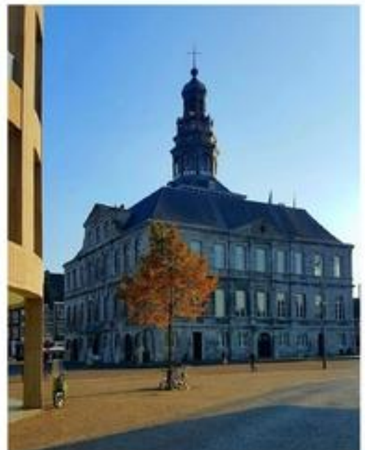
Foto van de maand oktober 2017 redactiekeuze : Jean Luijten en Leen van Antwerpen