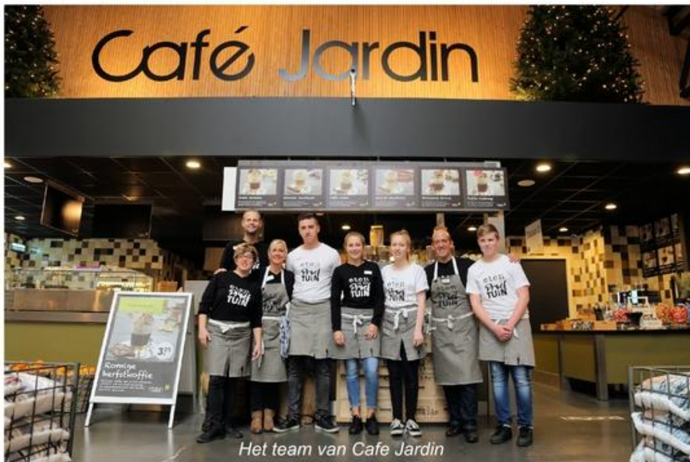
Het team van Cafe Jardin