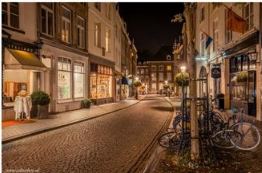
Foto 8: De gezellige straatjes van Wyck zijn s'avonds mooi verlicht.

Foto 7: Prachtig uitzicht over de stad vanaf de Kennedybrug.