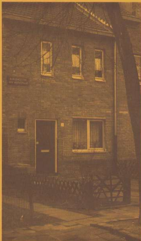
Een stukje Burg. van Akenstraat na het zandstralen van de gevel

tikel ziet alleen de voorgevel van nummer 111 er nog uit. De gelede ramen zijn overal elders vervangen, mede omdat diverse panden al gauw een winkelbestemming kregen. Zo huisvest nummer 107 al bijna vijftig jaar de kapperszaak Vrijhoeven. We zullen een goede verteller als kapper Vrijhoeven eens benaderen over een halve eeuw Van Oppenstraat. Tot slot is het aardig te vermelden dat op de plattegronden van de besproken complexen een school was gepland aan het Schepen Bemelmansplein en een nieuw parochiehuis aan het Schepen Helgersplein.