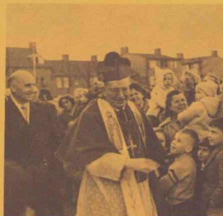
BIJ DE FOTO'S: 1. kerkwijziging 1958; r. rondgang 31 mei '65