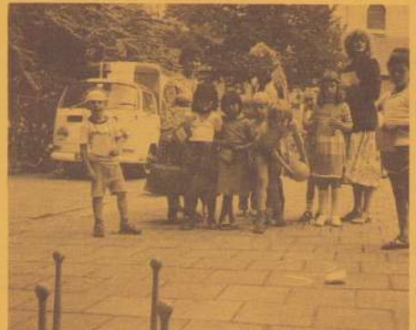
BEELDEN VAN DE SPELEN-MIDDAG VOOR DE KLEUTER- EN BASISCHOLEN OP 11 JUNI 1982