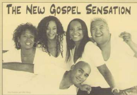
Stichting Cultuur sur Place: De stichting draagt een steentje bij aan meer onderlinge samenhang in de samenleving. Om dat te bereiken laat zij mensen op een laagdrempelige manier over de schutting van hun eigen cultuur kijken. Het Manus van Alles Festival blijkt daarvoor een succesvol middel te zijn.

Oh happy day, Shackles, Lovely day, He's all over me, Your love keeps lifting me higher and higher en veel meer andere evergreens staan op het programma van het concert in Maastricht. The New Gospel Sensation is een groep die iedereen in beweging brengt met de meeslepende klanken van beroemde gospelsongs. Verrassend is ook de manier waarop de groep bekende popsongs in een funky gospelstijl presenteert. De mix van stijlen maakt van dit kerstconcert een swingende gospelshow met ingetogen momenten. The New Gospel Sensation kan als geen ander harten veroveren. Daarom treden ze ook regelmatig op bij trouwpartijen van sterren zoals Edwin van der Sar. Het publiek mag dan ook kippenvolmomenten verwachten.