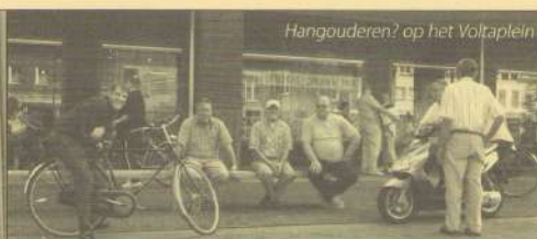
Hangouderen? op het Voltaplein