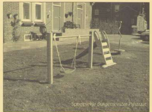
Speelplek Burgemeester Pijstraat