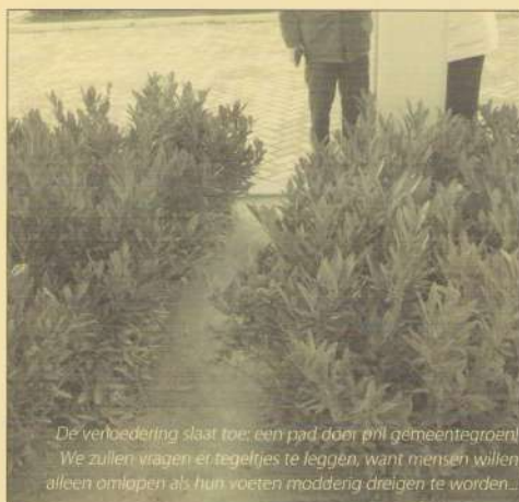
De verdediging slaat toe: een pad door pfl gemeentegroen! We zullen vragen ertegeljes te leggen, want mensen willen alleen omlapen als hun voeten modderig dreigen te worden...