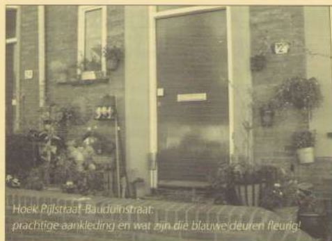
Hoek Pijlstraat-Bauduinstraat: prachtige aankleding en wat zijn die blauwe deuren fleurig!

Niemand schijnt erover te piekeren de oude bewoners de kans te geven te blijven of terug te keren. Wat sociaal beleid? Zijn er echt voldoende gelijkwaardige alternatieven voor al die gedwongen verhuizingen, hoeveel "stadsnomaden" gaat dat opleveren? Ook al krijgen ze voorrang bij het Woningburo?