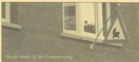
Nieuw leven op de Eburanenweg.