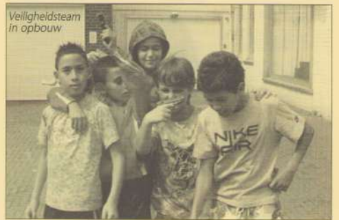
Veiligheidsteam in opbouw

(jan.segerink@trajekt.nl) of beneden in z'n kantoor.