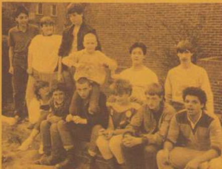
Bij de foto : De leeftijden in deze "groep" jongeren lopen zeer uiteen .

Bij de groep rond de Blokkenschool zijn ook een paar die behoren tot de zg. "Skin-heads". Ze zien er wat stoer uit en hebben het hoofd kaal geschoren. Ze vertellen ons wat over hun doen en laten. Ze zijn fel gekampt tegen "punkers" omdat deze volgens hen weerloze mensen het leven zuur maken. Daar wordt dan ook regelmatig mee ge-