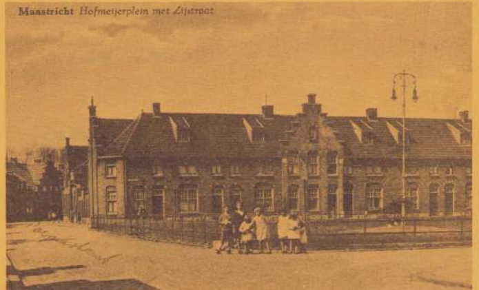
Maastricht Hofmeijersplein met Zijstraat