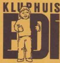
Bij de foto's : de vrijwilligers van EDI

Het tien-jarig bestaan van Kluphuis EDI wordt uitgebreid gevierd: