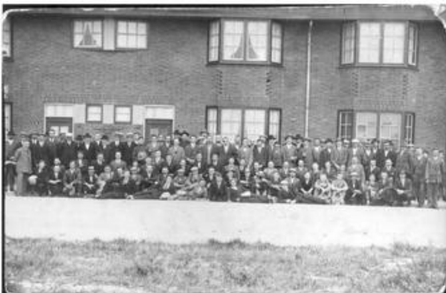
De stakers van de Nederlandse Vereniging van Fabrieksarbeiders tijdens de staking in 1929.

Er werd ook gescholden, maar wee degene die het scheldwoord 'duikboot' gebruikte! Die werd ogenblikkelijk door de politie op de bon geslingerd. Ook tegen stenengooiers werd opgetreden.