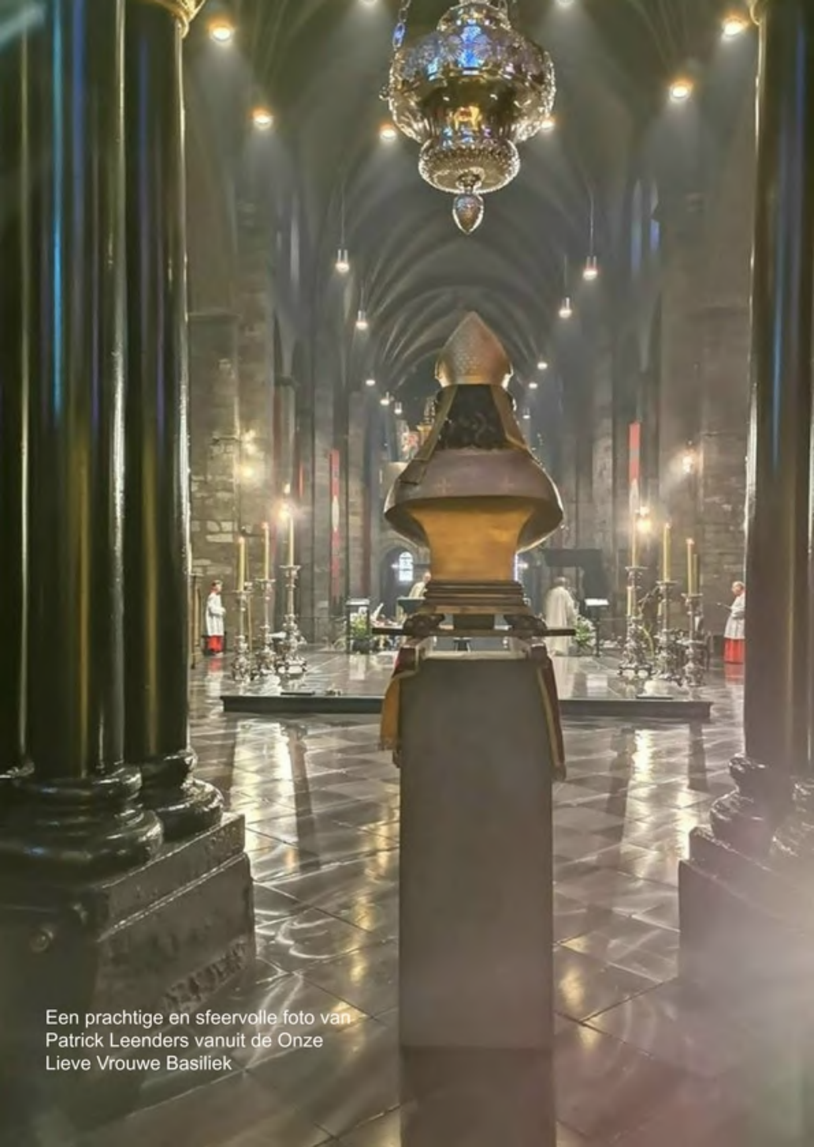
Een prachtige en sfeervolle foto van Patrick Leenders vanuit de Onze Lieve Vrouwe Basiliek