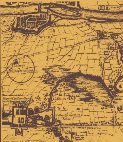
MELAATSENHUIS EN GALGENVELD

Bovenstaand kaartfragment is een momentopname van de belegering van Maastricht in 1632 door Prins Frederik Hendrik, de jongste zoon van Willem van Oranje, welbekend sinds de t.v.-serie. Onderaan in het midden zien we de kerk van Amby en rechts daaronder de kanonnen van de beroemde gene-