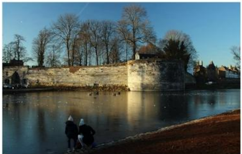
Foto van de maand augustus 2017 redactiekeuze : Helen van den Broeck-Nobelen