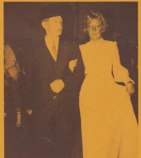
Mode-show in het Trefcentrum. (of: "op weg naar jaarvergadering van de Witte Vrouwenwerkwinkel", red.)

willen ondernemen. Vrouwengroepen uit de buurt die activiteiten op het gebied van de vrouwenemancipatie willen opzetten, zullen door ons, waar we kunnen, financieel ondersteund worden. Verder leeft bij ons het idee om het vroeger in onze wijk zo bekende praatcafé, nieuw leven in te blazen. Je weet wel die gezellige afwisseling van show en serieuze gesprekken met gasten over een aantal onderwerpen. Daar zal dan zeker ook het onderwerp vrouwenemancipatie aan de orde komen. (Het stadsbestuur kan de borst alvast nat maken. red.)