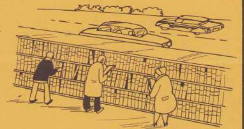
EEN ALTERNATIEVE GELUIDSMUUR VOOR OOSTERMAAS