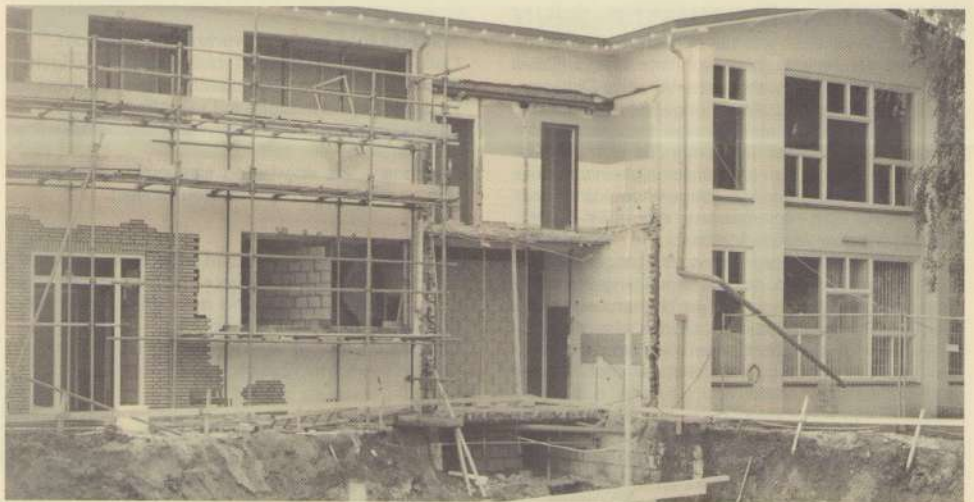
Maris Stella in de steigers. In het rechter gedeelte ziet U onze redactie thans driftig zitten te computeren. Het is nog geen tien jaar geleden dat plakken, knippen en copyeren nog met de hand moest gebeuren. Schaar en pritt worden trouwens ook nu nog gebruikt, maar de tekst wordt uiteindelijk keurig op diskette aangeleverd voor de drukker. Maris Stella is, ook nu de verbouwing alweer enkele jaren geleden achter de rug is, nog steeds het brandpunt van de buurt. Telt u alleen maar eens het aantal keren dat tel.3620066 in dit krantje staat vermeld. Deze maand trouwens weer veel aandacht voor jeugd- en jongerenwerk. De volgende keer....meer.