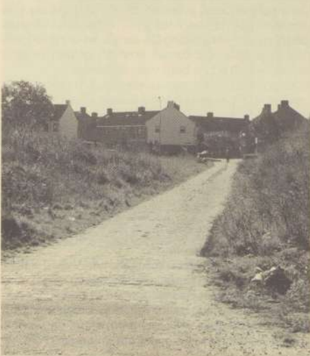
Een weggetje uit de steentijd. Vijftien jaar geleden maakten we een leuke reportage over de fietscrossbaan die hier toen door buurtbewoners was aangelegd. Nu wonen de fietscrossertjes van weleer er als eerzame burgers in koophuis (Habsburgerplein).

Uw redactie bestaat al sinds jaren uit een kwartet gewaardeerde buurtgenoten, inmiddels al wat op leeftijd. Nu we al bijna aan de 22ste jaargang toe zijn, moeten we zo langzamerhand eens aan opvolgers gaan denken. Niet dat wij al versleten zijn: nee. We lusten nog steeds graag een pintje. Maar het gevaar bestaat natuurlijk dat je jezelf na verloop van tijd gaat herhalen als de bronnen van inspiratie beginnen op te drogen. Toen de buurtkrant startte zo rond 1979 viel er op het redactionele front nog veel nieuws te vermelden. De betonwoningen moesten tegen de vlakte, en de buurtwerkers stonden op de bres voor