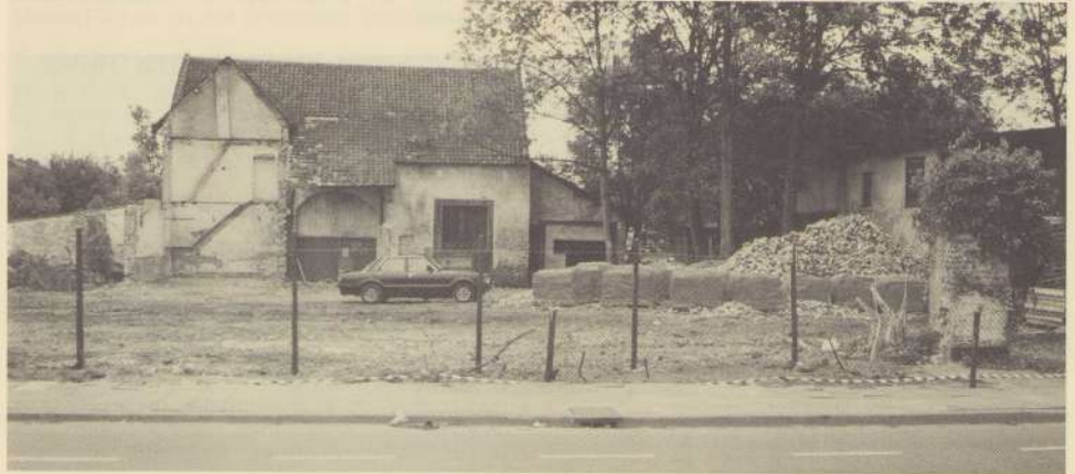
Nog een overblijfsel uit vroeger tijden, toen Wittevrouwenveld nog grensde aan agrarisch gebied. De boerderij is inmiddels gesloopt, maar het terrein ligt nog steeds braak. Een van de laatste plekken aan de rand van onze buurt waar het jaar 2000 nog niet is doorgedrongen.

veranderd. Langs het verdwenen Pastoor Jacobsweggetje wordt een dezer dagen een nieuwe Gamma geopend. Het Geusseltplein is geweldig van aanzien veranderd: het gonst er thans van bedrijvigheid. De Olympiaweg zal nu ook eindelijk worden doorgetrokken zodat Amby een rechtstreekse verbinding krijgt met de snacks alhier verkrijgbaar. Ook aan de achterkant van het stadion langs de vijvers wordt alweer gebouwd. Ontsluiting van een buurt, zou de kop van een hoofdartikel kunnen luiden. We krijgen de 25 jaargangen dus nog wel vol. Alleen al een blik op de foto's van 10, 20 jaar geleden levert stof op voor vele nostalgische opmerkingen. Daar zullen we het voor deze keer dan maar bij laten, hoewel onze eventuele opvolgers zich rustig al kunnen melden!