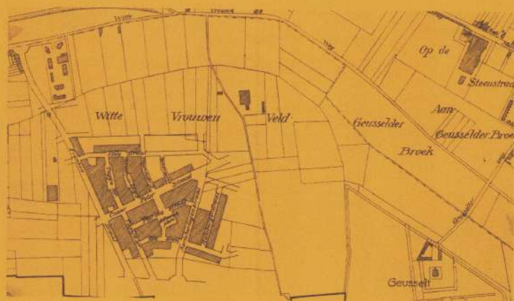
WITTEVROUWENVELD EN GEUSSELT IN 1923 DRIE JAAR NA DE VERHUIZING VAN AMBY NAAR MAASTRICHT. (PLATTEGROND DOOR JOS VLUGGEN).