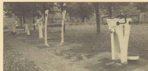
In Brunssum zagen we dit, wie weet komt dit ook naar de Groene Loper.