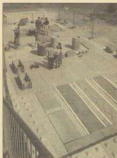
De beweegtuin in aanbouw

De beweegtuin is voor iedereen toegankelijk, dus tevens te gebruiken om gezellig even te zitten. Ook andere zorgverleners mogen vrij gebruik maken van de tuin. De organisatie bedankt alle mensen uit de wijk die vrijwillig hebben meegewerkt aan de realisatie.