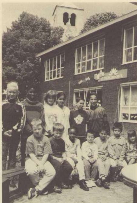
Het schoolteam is trots op het feit dat zoveel nationaliteiten, in een goede sfeer, met elkaar spelen, werken en leren (ook van elkaar). Op de foto zijn alle nationaliteiten bij elkaar gebracht.

Ook zullen nu, bij het begin van het nieuwe schooljaar, alle groepen voorzien zijn van nieuw meubilair. De nu 66-jarige school werd onlangs op de lijst van jonge monumenten geplaatst. Na de verbouwing kan het gebouw zijn tweede jeugd beginnen voor de jeugd van Wittevrouwenveld.