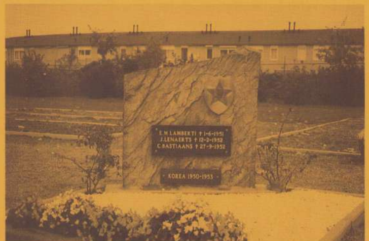
Monument voor de gevallen tijdens de Korea-oorlog. Op de achtergrond: het urnenveld in aanleg.