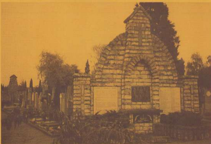
Een van de kruiswegstaties met gedenkplaten voor oorlogsslachtoffers en gevallen van WO 2.