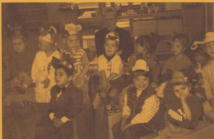
Aandachtige peuters in de peuterspeelzaal tijdens een optreden van Ruben's Poppentheater.