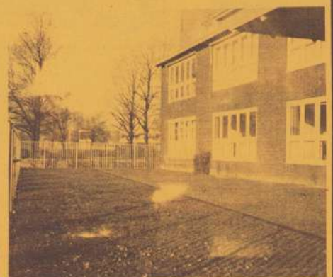
Bij de foto De voorkant van de Theresiaschool; nu nog een kaal grasveld, straks ingericht als schooltuin en door de kinderen beplant.

aan de benodigde financiën om dat stukje grond, dat welwillend door de kerk ter beschikking is gesteld, wat beter in te richten. Ondertussen is ook de Theresiaschool geïnteresseerd geraakt en deze wil eveneens beginnen met school-kinder-tuintjes. Daarop hebben de initiatiefnemers de koppen bij elkaar gestoken en een gezamenlijk plan gemaakt, waarvoor ze bij de Provincie en de Gemeente om subsidie gevraagd hebben. De verwachting is dat dit gehonoreerd wordt en dat men zeer binnenkort geld krijgt voor de aanschaf van allerlei materialen, zoals gereedschap, tegels, opsluitbandjes, enz. Want wat is de bedoeling? Zowel het braakliggend terrein achter de EDI als het grasveld voor de school worden ingericht met o.m. kweekbedden die van elkaar gescheiden zijn door opsluitbandjes en tegelpaden. En dat zal heel wat werk met zich meebrengen. Het omwerken van de grond e.d. wordt verzorgd door medewerkers van Dienst Schooltuinen van het Natuur historisch museum van Maastricht. (Deze Dienst zal de leerkrachten ook helpen met het inpassen van activiteiten in het lesprogramma) Maar vooral het plaatsen van de opsluitbandjes en het aanleggen van de tegelpaden zal gedaan moeten worden door vrijwilligers uit de buurt en/of ouders van school. Uw hulp is dus noodzakelijk!!! Bent u geïnteresseerd? Bel dan even Pie Hamelers (620607), Rinus Creusen (620662) of Hans Sleijpen (620115) Doen!