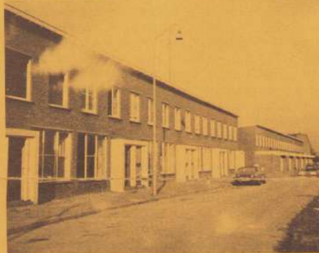
Bij de foto Tussen de half gesloopte huizen zijn nog woningen bewoond.

huurprijs ook een glasverzekering hebben en die daarom zelf nog een glasverzekering hebben afgesloten. Ook zijn er bewoners die ten onrechte denken dat ze geen recht hebben op huursubsidie of huurgewinning. Het zou toch een kleine moeite moeten zijn voor het Woningbedrijf om bij de ondertekening van het huurcontract de mensen hierop te attenderen.