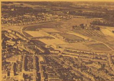
Bij de foto Een opname uit 1961 ; toen nog Witte Vrouwenveld