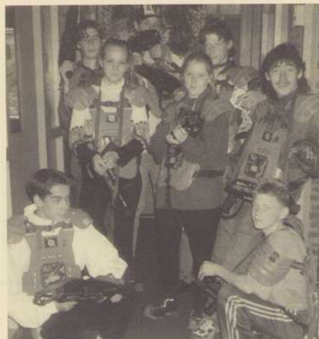
Een van de vele activiteiten van het jongerenwerk: lasergame in Valkenburg.