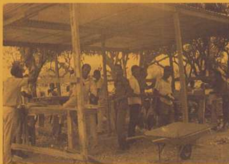
De timmerwerkplaats in Nyarubele.