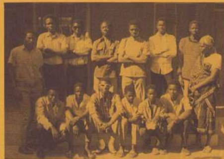
De toekomstige timmerlieden.